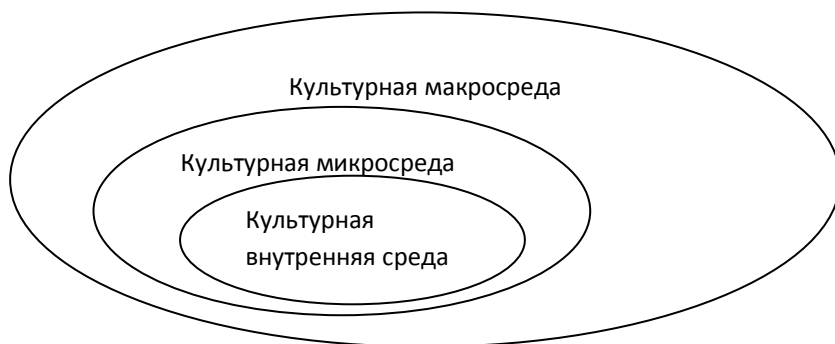
Рисунок 1: Состав маркетинговой среды (вариант 1)

Культурная макросреда может влиять на внутреннюю среду как опосредованно (рис.1), так и напрямую (рис.2). Соответственно, состав маркетинговой среды графически может быть представлен двумя способами: